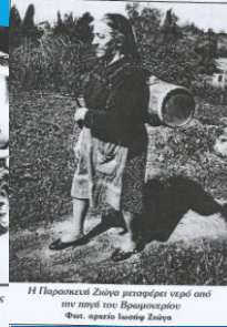
Η Περσική Ζωίγα μεταφέρει νερό από την παλιά του Βραχμακέρου